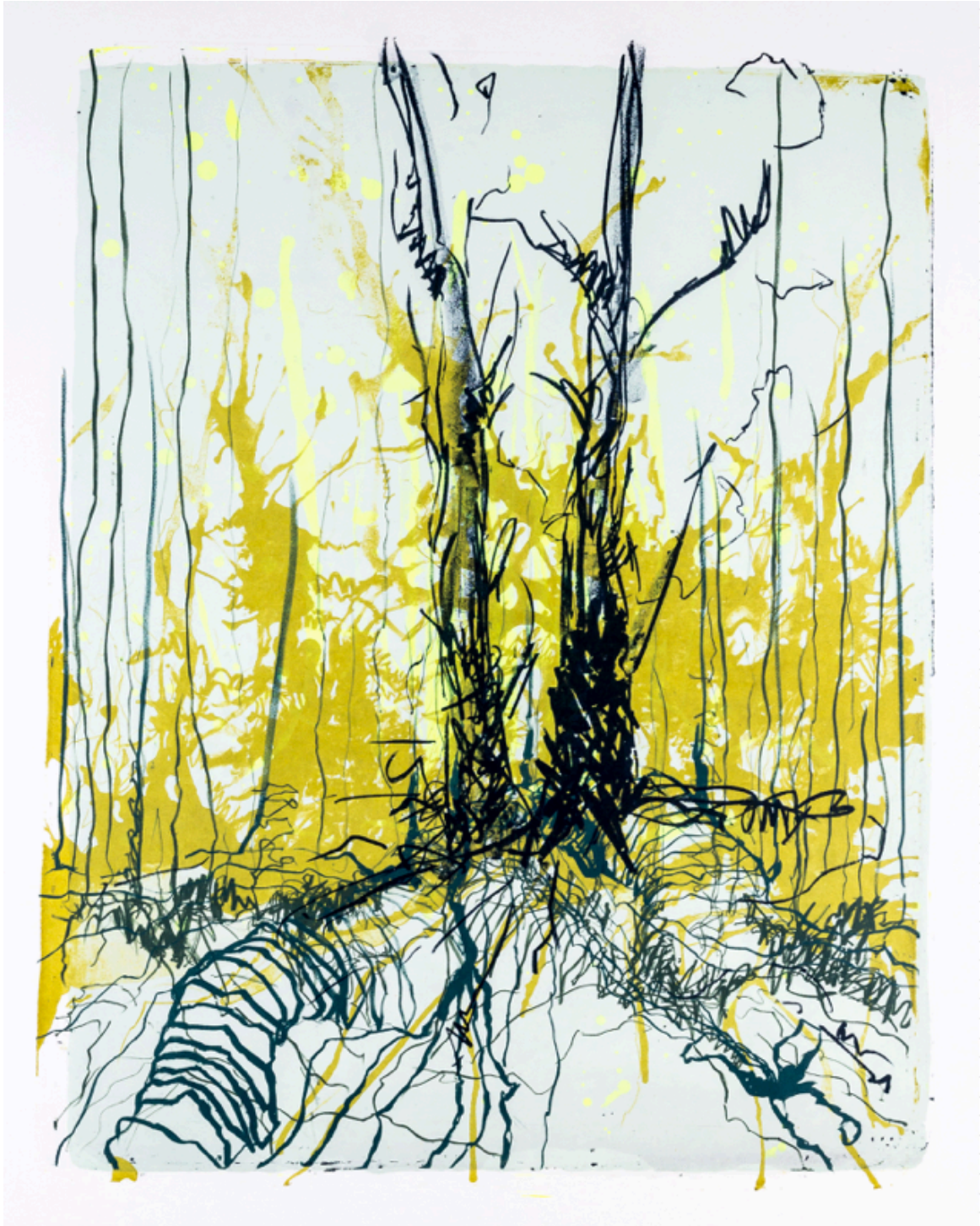
Katharina Albers Wald X-VII 2017 Farblithografie 50 x 40 cm